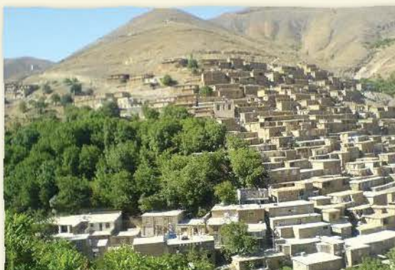
نمایی از یک روستا

۱۰ شهر، بزرگ‌تر و پرجمعیت‌تر از روستاست.