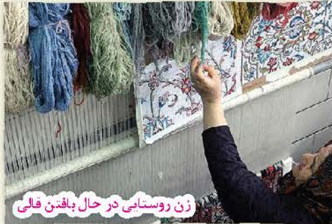
زن روستایی در حال بافتن قالی

۱ کشور ما ایران شهرهای زیبا و روستاهای آباد زیادی دارد.