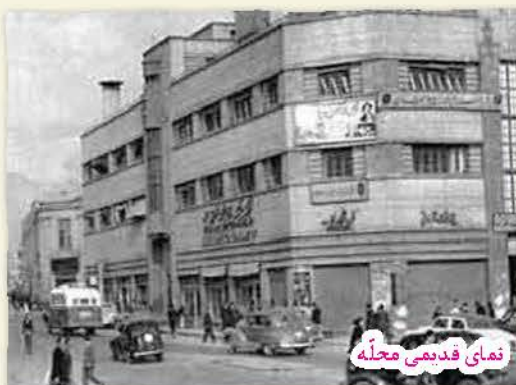
نمای قدیمی محله