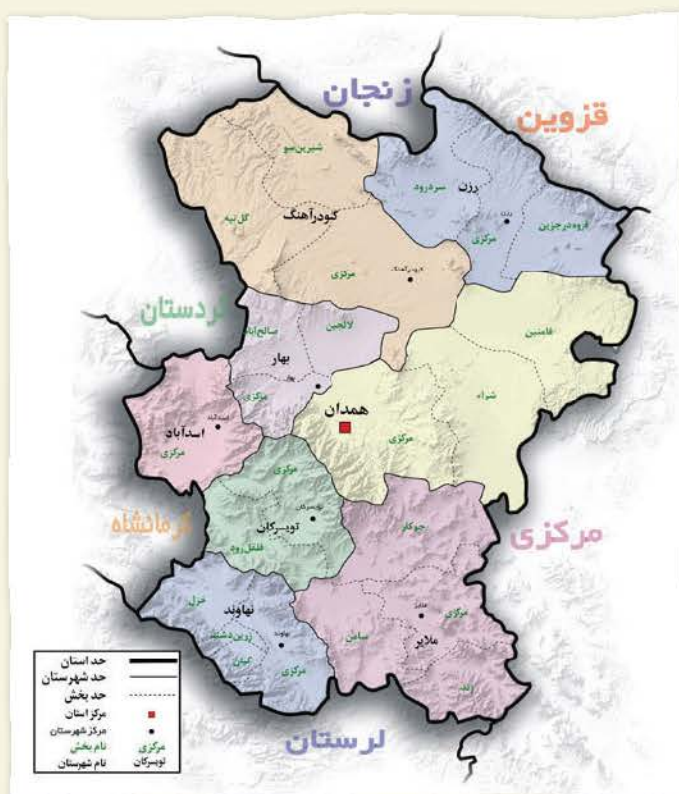
نمونه‌ای از نقشه‌ی یک استان به همراه راهنمای آن

خیابان، فرودگاه و چیزهای دیگر را روی نقشه نشان می‌دهد.