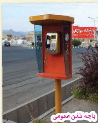
باجه تلفن عمومی