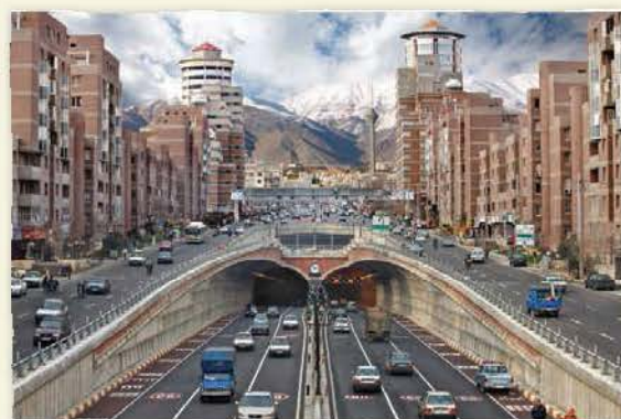
نمایی از یک شهر