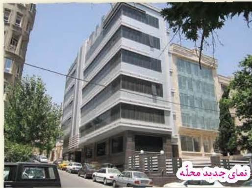
نمای جدید محله