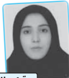
رتبه‌ی ۲۱ تجربگی ۹۰

این مجموعه را به سوزنی کتاب جمع بندی زبان سروداه حد بسیار نزدیکی کتاب لازم و محدودیت که در یک قسم واقعا مناسب بود که هم نیازم به ایت در زبان راحت می کرد و هم این از فرصت را در این کتاب تمام زبان بیشتر را دردی زد که در کتاب ضف نام گرفته است سیامی قاضی ۹۰/۴/۱۳