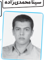
رتبه‌ی ۲۱۲ ریاضی ۹۰

این کتاب نه تنها چه نکات به درخیز برای صدوه از زبان نوی کنگور و داره بلکه روی مهم ترین نکته های که احتمال داره طراح آزمون تست مطرح که تا کنگور و داره داره. بنابراین هر نوی کتابی مفیدتر و جامع تر از این کتاب پیدا کنی. کتابی که معجون نکات باشه و همه سبک ها را بکونه پوشش بده کم پیدا می شه. قدرشو بدون ... از ما گفتن بود و از تو شنیدم