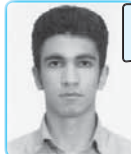
رتبه‌ی ۳۷ ریاضی ۹۰

تو این کتاب مجموعه چینی بدی این مجموعه هم می باشد در این باره گرفت و هم هرگز نگردد تو این کتاب آخرت منگی نیست و این به خاطر نویسنده ویراستاری خوبه