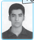
رتبه‌ی ۴۷ تجربگی ۹۰

تو این کتاب مجموعه چینی بدی این مجموعه هم می باشد در این باره گرفت و هم هرگز نگردد تو این کتاب آخرت منگی نیست و این به خاطر نویسنده ویراستاری خوبه