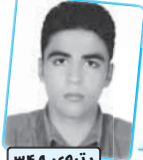
رتبه‌ی ۳۴۸ تجربگی ۹۰

درسته که title این کتاب جمع بندی است و complete مطالب زبان کنگور و cover کرده که نگه می دارم بهر حال top براس منابع. source و منبع اینها داشته باشند. خدمت خیر تر از این است که این کتاب به هم داشته اند که در اولت هاس خارج و کتاب واقعی خودم کرده. by the way به نظرم در حد ۹۰ کنگور خودتون رو نشین کنه.