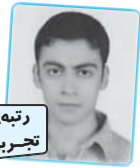
رتبه‌ی ۷ تجربگی ۹۰

کتاب حق بدی زبان سروداه آن مخصوصه هیات مخیره نوعالی دارد که واقعا حقا که در این کتاب درشوار است اما شما از معتبرین این خصوصیات رسانده داوران - بالاقریه آگاهی در کترین زبان صلح است که علاوه بر آن داوران را با تست های فکریه از آسمانی که به خطین این کتاب پی ۴۴۳ جلدی در درسی زبان است