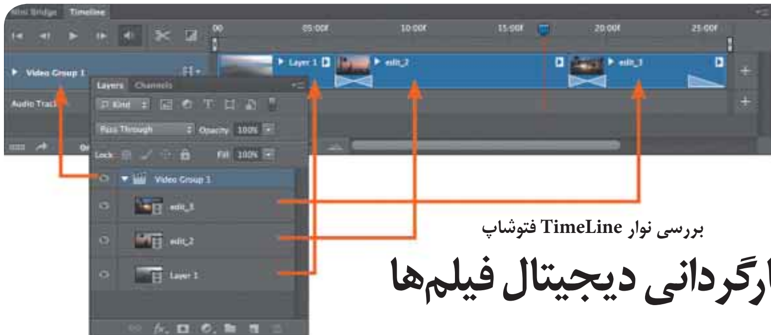
بررسی نوار TimeLine فتوشاپ